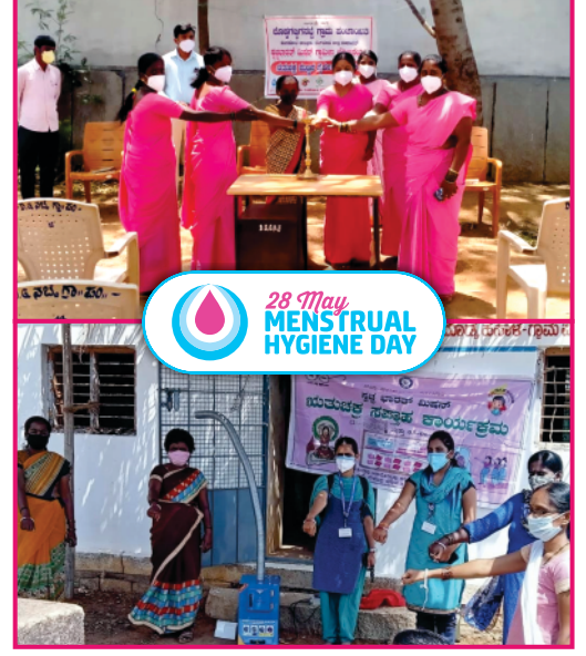
28 May MENSTRUAL HYGIENE DAY

ಋತುಚಕ್ರದ ಬಗ್ಗೆ ಗ್ರಾಮೀಣ ಪ್ರದೇಶದ ಜನರಲ್ಲಿ ಜಾಗೃತಿ ಮೂಡಿಸುವ ನಿಟ್ಟಿನಲ್ಲಿ ಗ್ರಾಮೀಣ ಕುಡಿಯುವ ನೀರು ಮತ್ತು ನೈರ್ಮಲ್ಯ ಇಲಾಖೆ ಕಾರ್ಯ ನಿರ್ವಹಿಸುತ್ತಿದೆ. ಗ್ರಾಮೀಣ ಪ್ರದೇಶದಲ್ಲಿನ ಮಹಿಳೆಯರು ಇಂದಿಗೂ ಹಳೆಯ ಕ್ರಮಗಳನ್ನೇ ಅನುಸರಿಸುವುದರ ಜೊತೆಗೆ ಋತುಚಕ್ರದ ಸಂದರ್ಭದಲ್ಲಿ ಎದುರಾಗುವ ಸಮಸ್ಯೆಗಳ ಬಗ್ಗೆ ಮುಕ್ತವಾಗಿ ಮಾತನಾಡಲು ಹಿಂಜರಿಯುತ್ತಿದ್ದಾರೆ. ಹೀಗಾಗಿ ಅನೇಕ ರೀತಿಯ ದೈಹಿಕ ಸಮಸ್ಯೆಗಳನ್ನು ಎದುರಿಸುತ್ತಿದ್ದಾರೆ. ಇಂತಹ ಮಹಿಳೆಯರನ್ನು ಮಾನಸಿಕವಾಗಿ ಸದೃಢರನ್ನಾಗಿಸುವ ಕಾರ್ಯ ನಮ್ಮಿಂದಾಗಬೇಕಿದೆ. ಆದ್ದರಿಂದ ಮೇ 28ನ್ನು ವಿಶ್ವದಾದ್ಯಂತ Menstrual Hygiene Day ಆಗಿ ಆಚರಿಸಲಾಗುತ್ತದೆ.